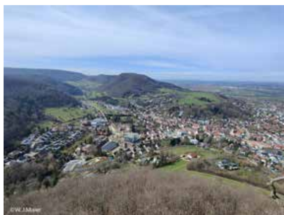
Blick von der Burgruine Rosenstein auf Heubach