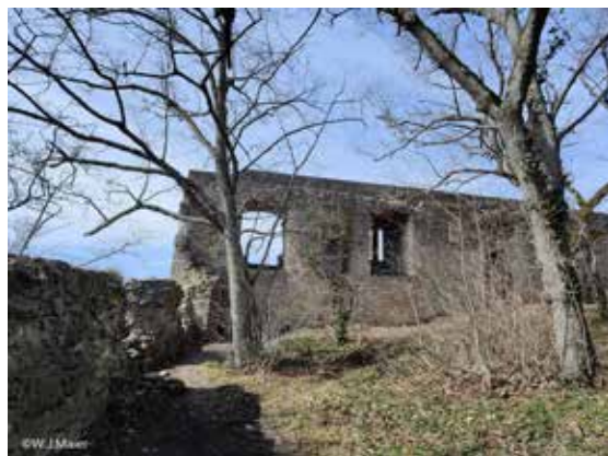
Die Burgruine Rosenstein

Unsere erste Wanderung im Jahr 2023 führt uns vom Wanderparkplatz Rosenstein zum Rosenstein bei Heubach im Ostalbkreis.