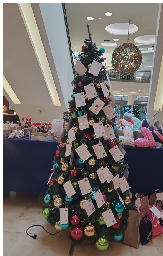
Wünschebaumaktion Glacis-Galerie Neu Ulm.

Unsere nächsten Aktionen Haus Konrad ADVENTSFEIER