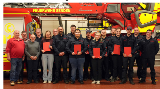
Die Geehrten und Ernennnten der Feuerwehr Senden im Rahmen der Jahres- und Dienstversammlung

Bürgermeisterin Schäfer-Rudolf und Matthias Thuro dankten der Feuerwehr Senden für ihren Einsatz zum Wohl der Bevölkerung.