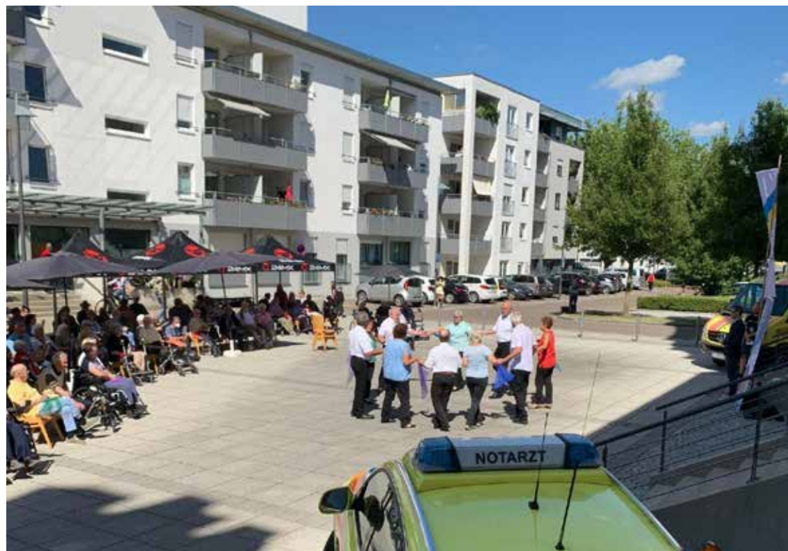
Gruppe der Tanzsportabteilung beim Donauwalzer beim ASB

Aktuelle Informationen aus Ihrer Nähe – Ihr Mitteilungsblatt. Empfehlen Sie uns weiter.