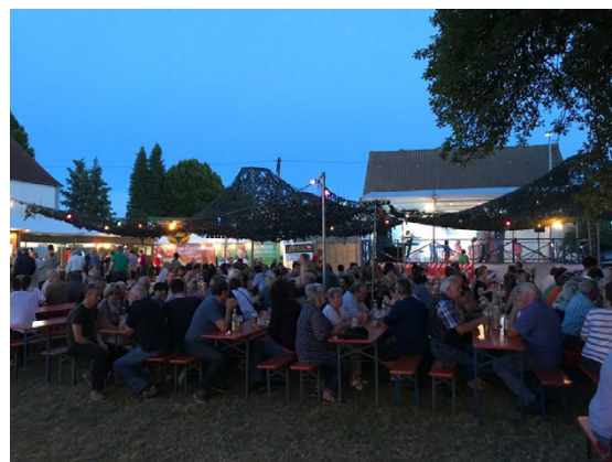
Abendstimmung im Pfarrgarten neben der Kirche

Die Freiwillige Feuerwehr Witzighausen freut sich auf Euren Besuch!