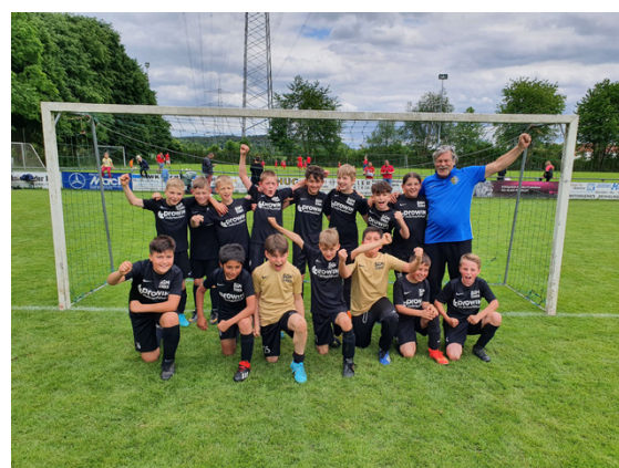
Turniersieg in Ay