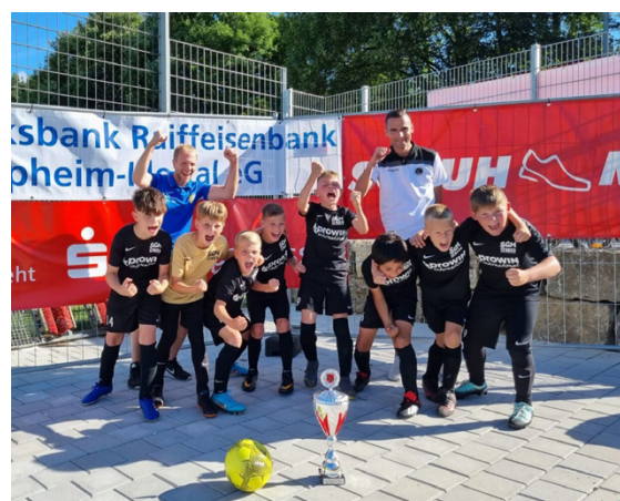
Turniersieg in Achstetten