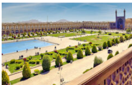
Iran: Der Naqsch-e Rostam Platz

Wolfgang Kiesecker nimmt uns in seiner Show auf eine gut 4000 Kilometer lange Reise durch ein faszinierendes Land mit. Im Rahmen der Rundreise besuchen wir viele historische Sehenswürdigkeiten, tauchen aber auch ein in die lebendigen Städte des Iran und erleben offene Menschen und eine beeindruckende Gastfreundschaft.