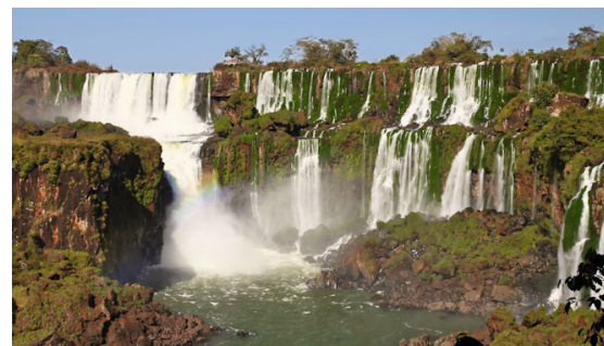
Brasilien - Iguacu-Fälle